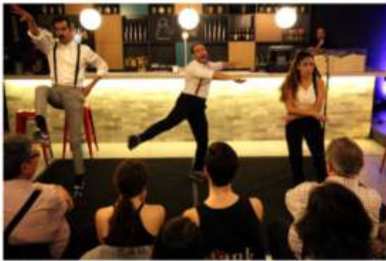
En este montaje, los actores cantan y bailan... pero sin guion.

Barcelona - Jueves, 25/10/2018 a las 07:50 CEST