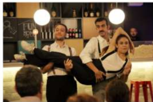
El trío improvisa diálogos y canciones, pero también coreografías.

Groucho Marx era un maestro del humor del absurdo y el surrealismo. Sus réplicas siempre eran justas, afiladas y muy originales. Parecía que no formaban parte de guion alguno, sino que las estuviera