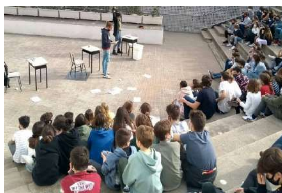
Jornades tallers IMPRO BULLYING 2021