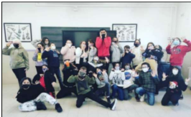
Escola El Pilar Premià de mar 2020