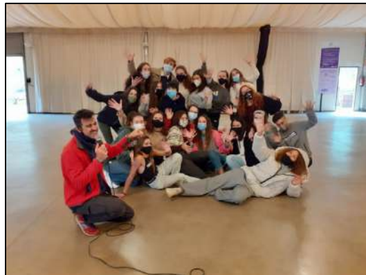
Institut LLUÍS DOMÈNECH I MONTANER Canet de mar 2020